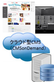
■クラウド型のCMSでコーポレートサイト、 ブランドサイトを一元管理

今後もクラウドCMSならではの拡張性を活かした効率的なサイト運用ならびに、今後新規に検討されていくWebマーケティングの各種施策にあたり、コネクティでは包括的にサポートさせて頂き、パートナーとしてソリューション提案とサービス提供をし続けて参ります。